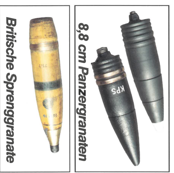
8,8 cm Panzergranaten