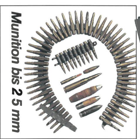
Munition bis 25 mm